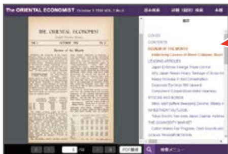
「October1 1934 VOL.1 No.6」の本文ページ

ファセット（絞り込み）機能で「記事種別」を指定すると、同種の記事を発行順（昇順／降順）に見ていくことができます。また、「年月日」や「号」で絞り込むことも可能です。