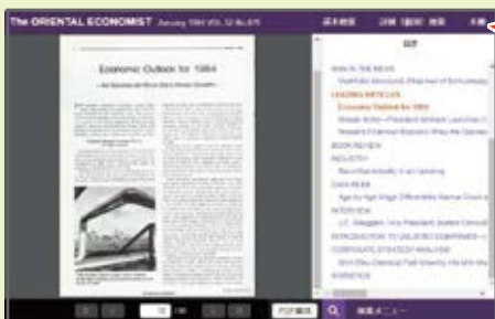
「January 1984 VOL.52 No.879」の本文ページ

冊子をあたかも書棚から抜き、ページをめくるようにしてじっくり見ていくことができます。