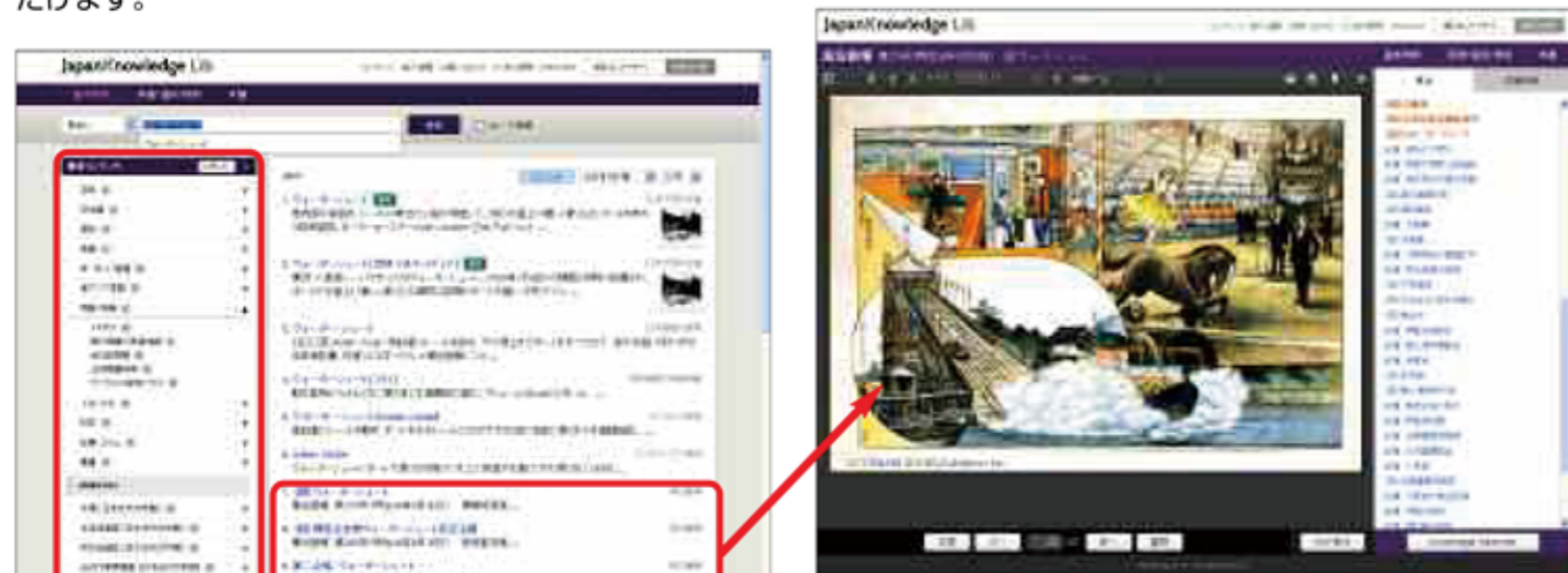
(左) ウォーターシュートで検索した検索結果画面。(右) 図「ウォーターシュート」(『風俗画報』第275号(明治36年9月30日)の本文画面)。

他のコンテンツと一緒に検索していただけます。歴史的な用語のイメージ補完に「風俗画報」の豊富な図版を使っていたいただけます。