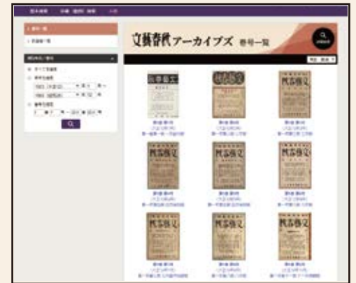
表紙画像をクリックすると、各巻の版面画像ビューアが開きます。

●巻号一覧: 収録されている巻号の表紙、巻号名、刊行年月を一覧表示します。刊行年月や巻号で表示される本の範囲を絞り込むこともできます。