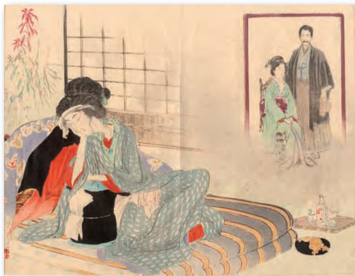
水野年方画 木版極彩色口絵（泉鏡花作「外科室」挿絵） （第6編、明治28年6月）分売①

芸妓・役者・芸人らの貴重写真や当時の世相風俗の記事も多数収録しており、近代文学研究はもちろん、美術・演劇・落語・風俗等の近代日本研究に必須の一級資料です。