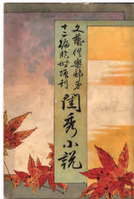
閨秀小説（第12編、明治28年12月）分売①